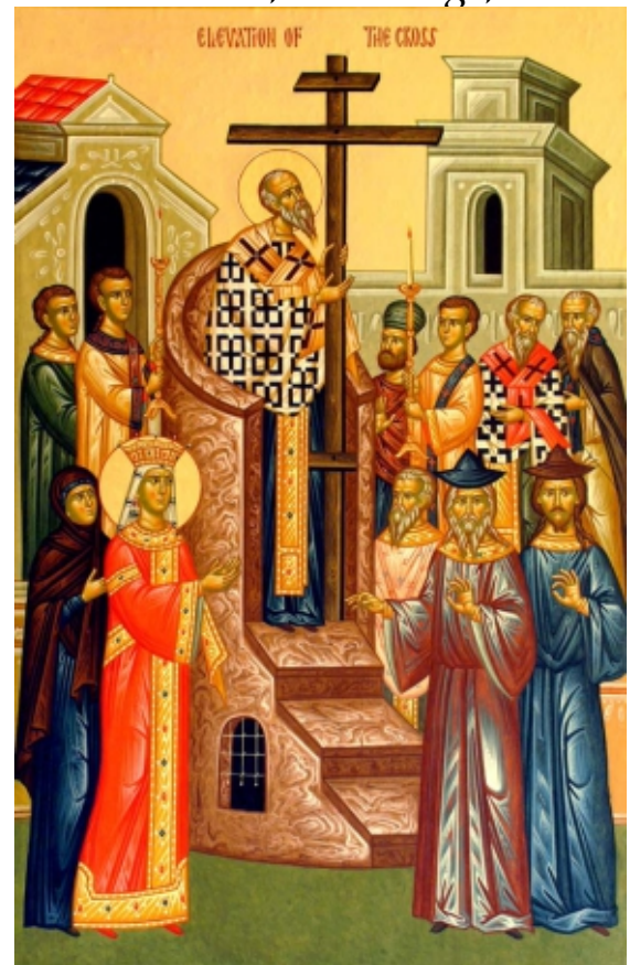
Воздвиження Чесного Хреста Exaltation of the Holy Cross