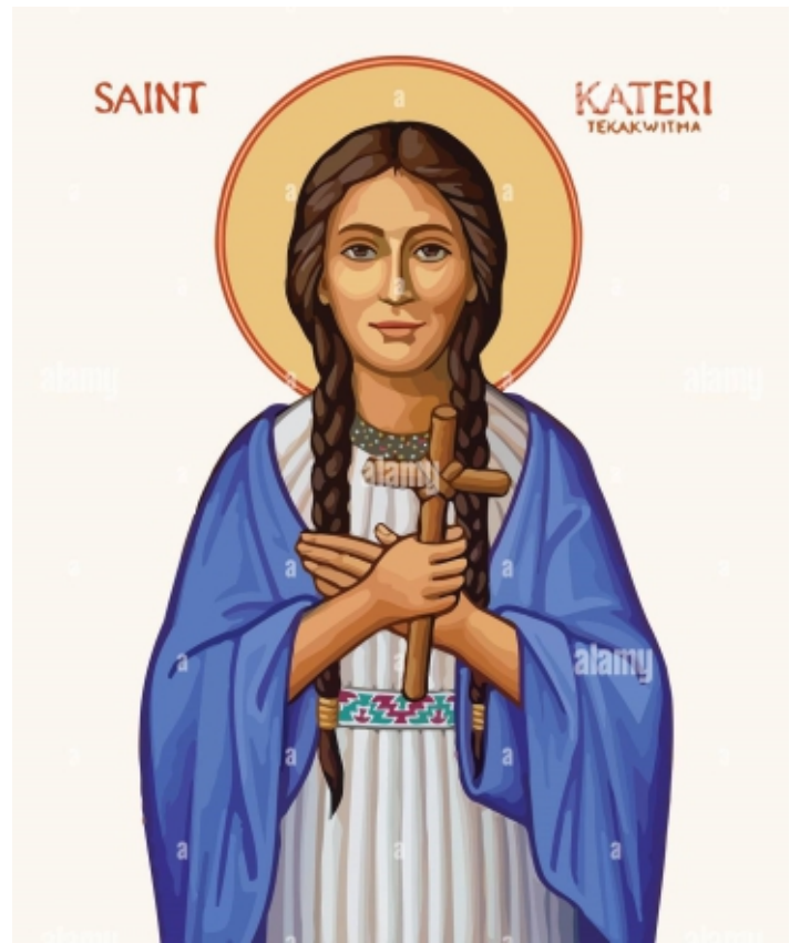
Свята Катери Saint Kateri